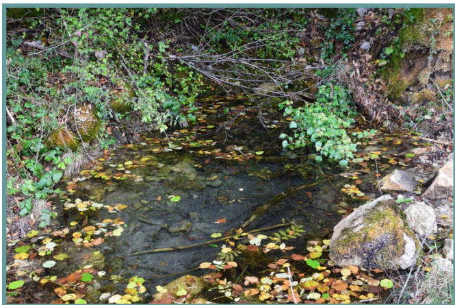
Une des résurgences en sortie du karst

du lac et seront remontés par l'apport d'argile et de cailloux. Ces résurgences qui maintiennent une température toute l'année de 10°C sont de réels habitats pour les espèces et la reproduction des poissons.