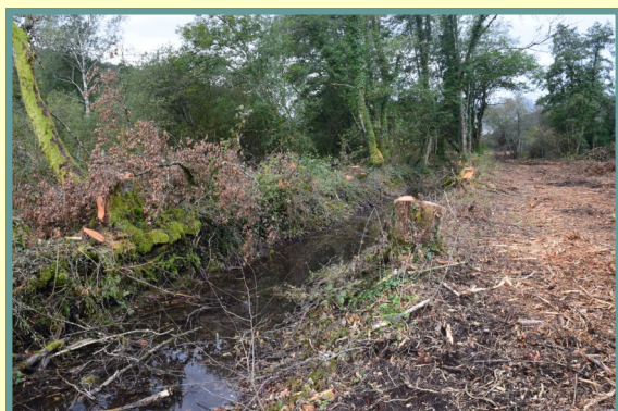
Lit canalisé du Hérisson, qui sera bientôt comblé

12 km de fossés seront ainsi comblés et 70 panneaux seront installés dans les fossés pour faire de petits barrages.