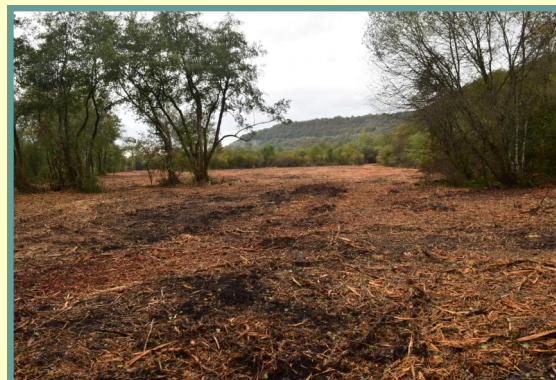
Nettoyage de la zone du marais

De nombreuses résurgences du 2nd plateau alimentent le lac et son marais, historiquement également canalisées. Les écoulements naturels de ces résurgences ont également subi l'abaissement