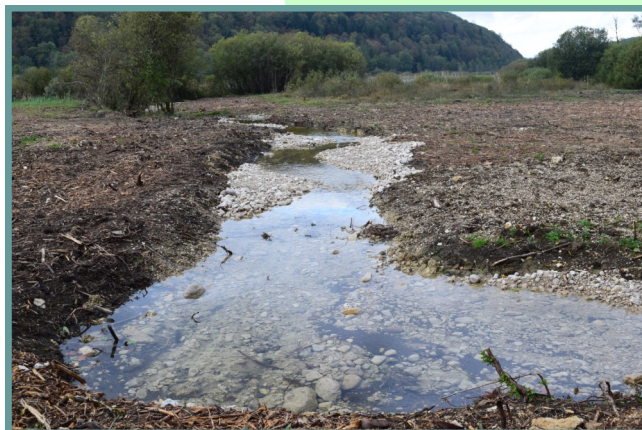
La résurgence a repris son cours et ses méandres naturels

Au fil du temps, les résurgences vont ainsi reprendre leur trajet et alimenter le marais et le lac.